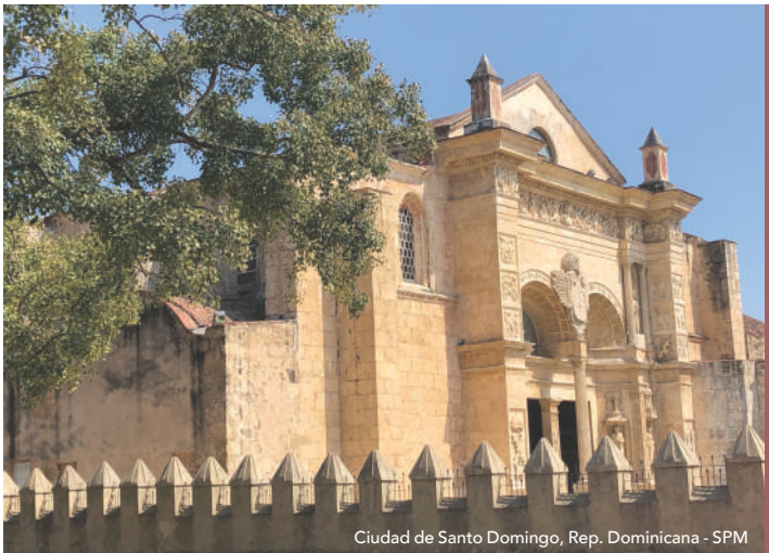
Ciudad de Santo Domingo, Rep. Dominicana - SPM

Sobre el Reporte 2024, destacan la cooperación consolidada con socios como el Instituto Nacional de Antropología e Historia de México, el Centro del Patrimonio Mundial de la UNESCO y el Centro Internacional de Estudios para la Conservación y Restauración de los Bienes Culturales (ICCROM), así como el establecimiento de nuevas alianzas y estrategias de colaboración con la Oficina Regional de la UNESCO en San José, Costa Rica, el Ministerio de Cultura de Panamá y la Cátedra UNESCO de Ciencias de la Conservación de Bienes Culturales de la Escuela Nacional de Conservación, Restauración y Museografía “Manuel del Castillo Negrete” del INAH.