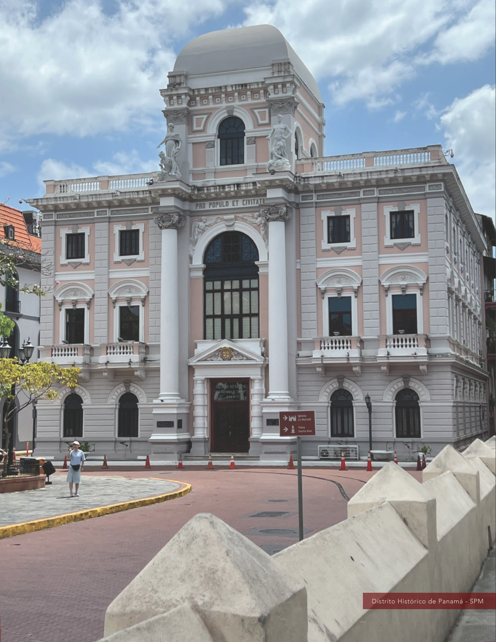
Distrito Histórico de Panamá - SPM

Centro Categoría 2 bajo los auspicios de la UNESCO