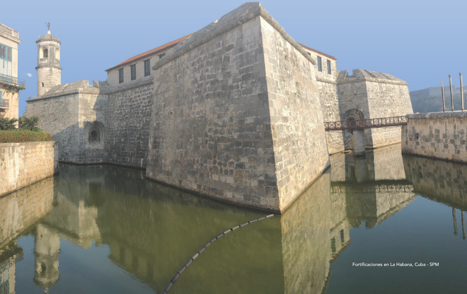
Fortificaciones en La Habana, Cuba - SPM

A diferencia del Plan de Trabajo 2023, que fue concebido todavía con base en el Plan de Acción para el Patrimonio Mundial en México y América Central (PAMAC), 2018-2023, el Plan de Trabajo 2024 del Instituto Regional del Patrimonio Mundial en Zacatecas (IRPMZ), Centro Categoría 2 bajo los auspicios de la UNESCO, ya fue configurado con base en el Plan de Acción para América Latina y el Caribe (2023-2029), aprobado durante la 45 Sesión del Comité del Patrimonio Mundial de la UNESCO en Riad, Arabia Saudita.